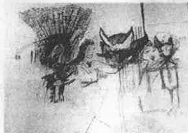
Œuvre de Josée Landry-Sirois pour le projet La Corriveau , un parcours littéraire et multidisciplinaire du Printemps des poètes présenté au MNBAQ.