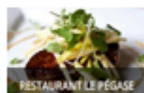
RESTAURANT LE PÉGASE